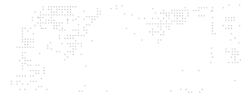
Tabela 1 – Quadro demonstrativo por fonte de recurso