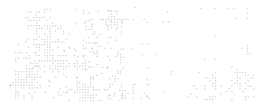
Tabela 1 – Quadro demonstrativo por fonte de recurso